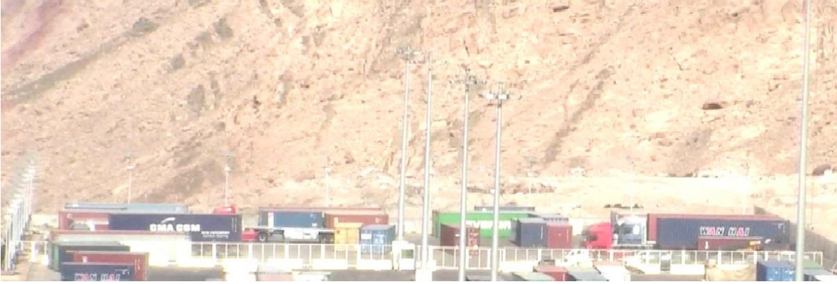
٨) ساحة إنتظار لسيارات وشاحنات بضائع المنطقة الاقتصادية (بضائع الرابية سابقا).