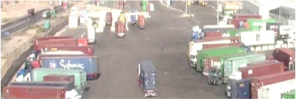
٩) ساحة التخزين الجديدة (ساحة ٥) وتتسع لتخزين (٦٠٠) حاوية مكافئة