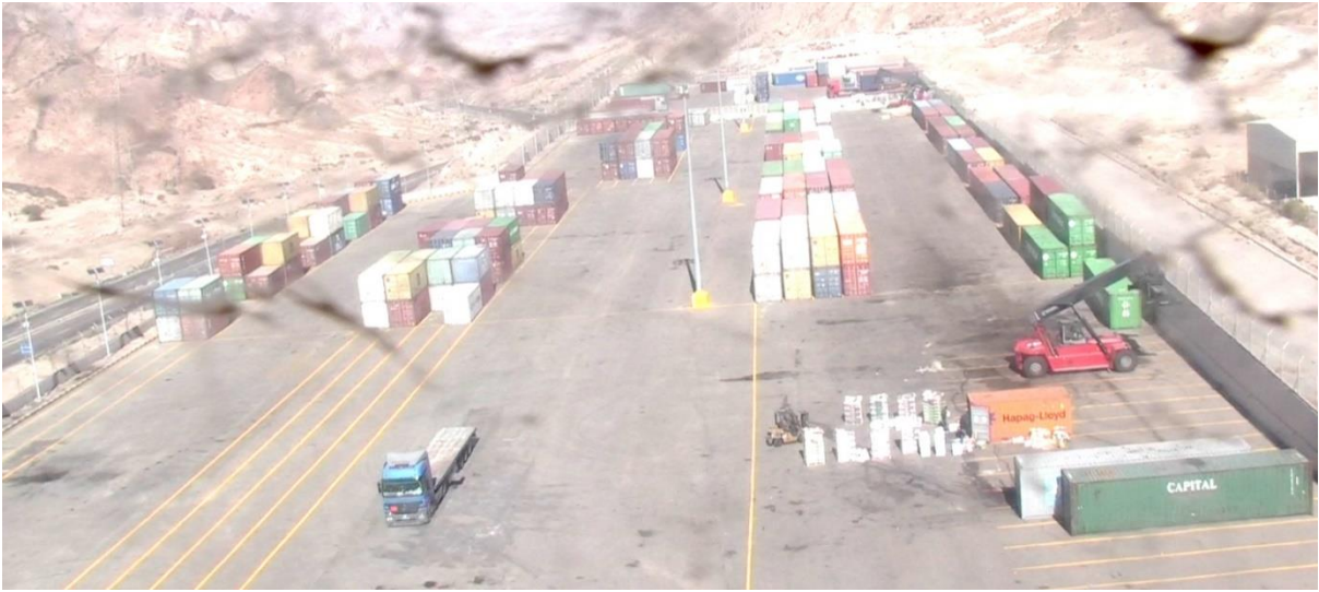
٥) ساحة انتظار الخروج للشاحنات: وتستوعب (٥٠) شاحنة