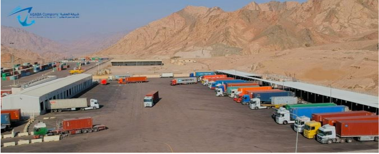
٤) مواقع للمعاينة الأرضية: ويتسع لمعاينة (٣٥) حاوية منها (٢٥) لمعاينة الحاويات الاعتيادية و(١٠) منها مخصصة لمعاينة حاويات المنطقة الاقتصادية.