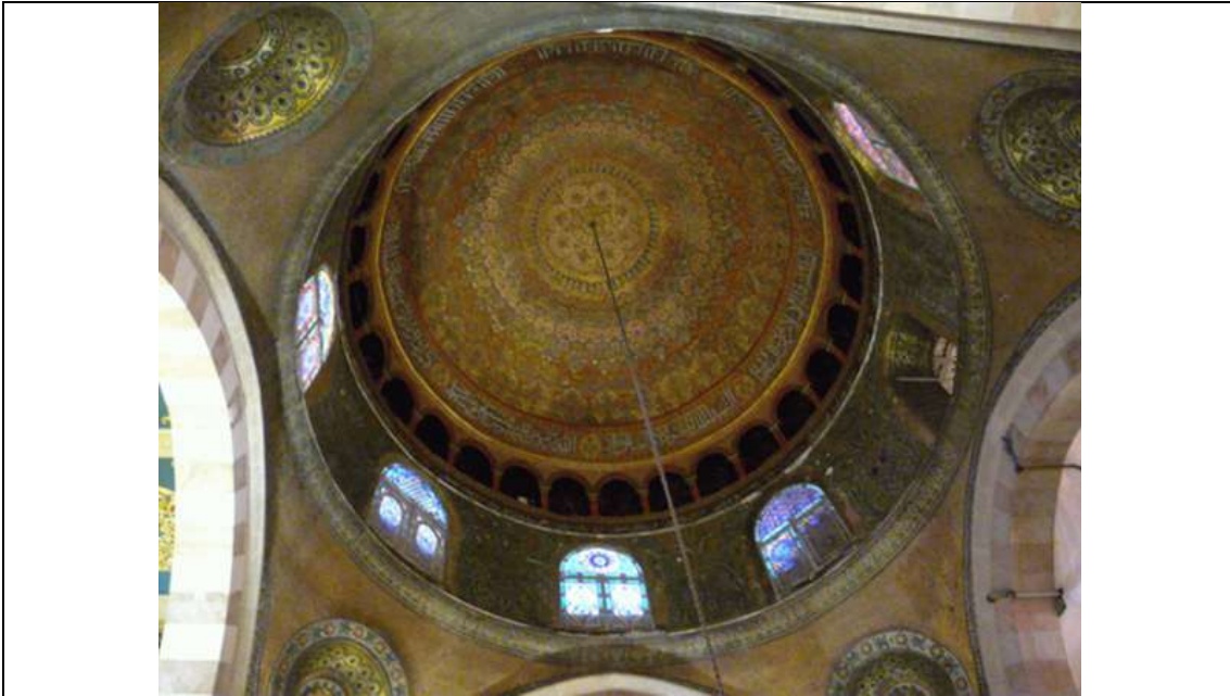
رقبة قبة المسجد القبلي قبل الترميم