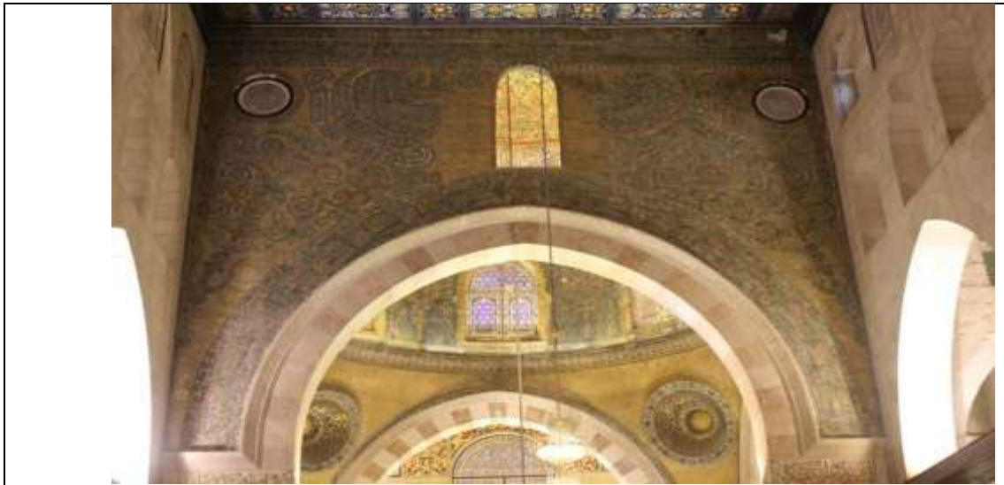
واجهة الرواق الأوسط قبل الترميم

يعد مشروع ترميم الزخارف الفسيفسائية الذي نفذته وزارة الاوقاف والشؤون والمقدسات الاسلامية الاردنية ودائرة اوقاف القدس من المشاريع الريادية لأعمار المسجد الاقصى المبارك ، والذي هو احد مشاريع المبادرات الملكية السامية ، حيث تم فيه ترميم جميع الزخارف التي تعرضت لتقلبات الزمن كما كانت أيام الدولة الاموية ، وهذا المشروع يعد الاول منذ ثمانمئة عام حيث اعيدت الزخارف الفسيفسائية كما كانت في السابق ، وقد استمر هذا المشروع اكثر من عشر سنوات وعلى عدة مراحل وفاقت نفقات هذا المشروع عن مليوني دولار وتبلغ اجمالي مساحة الزخارف الفسيفسائية التي تم توثيقها ودراستها وترميمها اكثر ١٥٤٥ مترا مربعا ، وفيما يلي بعض الصور التي تبين هذه الزخارف قبل الترميم وبعده .