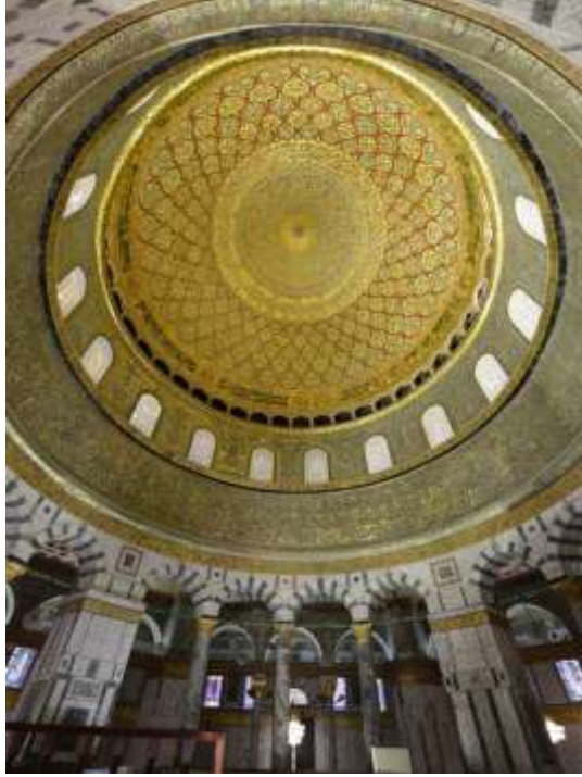
رقبة قبة الصخرة المشرفة بعد الترميم