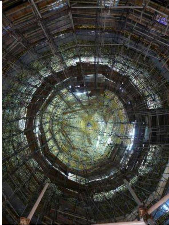
رقبة قبة الصخرة المشرفة قبل الترميم