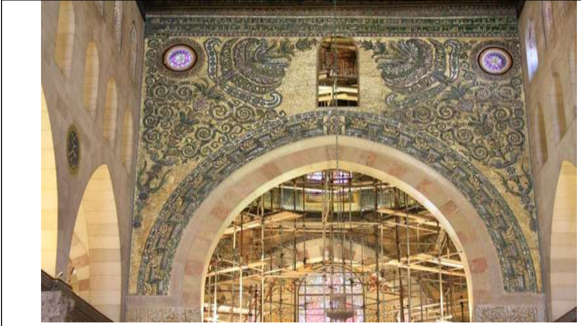
واجهة الرواق الأوسط بعد الترميم