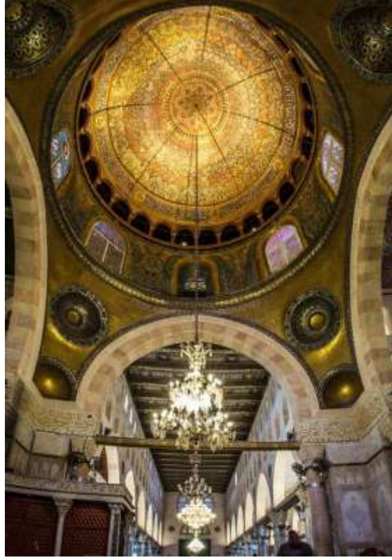
رقبة قبة المسجد القبلي بعد الترميم